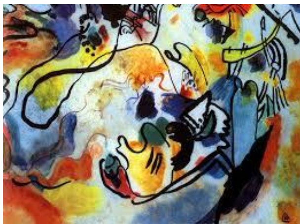
Василий Кандинский. «Страшный суд», 1912 г. [20]

Одна из проблем, которую должна решить фьючекультура, — «спасение жизни на Земле». Но это только одна проблема, не менее существенны другие, их достаточно много, однако основную, в плане формулирования начала (разговора, мышления), можно свести к проблеме кризиса «культурного смыслового проекта модерна» и настоящей необходимости нового смыслового проекта . Поясню, что имею в виду, говоря о «смысловом проекте культуры». Такой проект впервые был сформулирован отцами христианской церкви и философами (св. Августин и другие) как одно из условий (так видится в ретроспекции) становления культуры Средних веков. По сути, содержание этого проекта всем известно: Бог создал мир и человека; мир прейдет и будет конец света, второе пришествие Христа и Страшный суд; смысл человеческого существования — из «ветхого» стать новым, христианином, что выступает условием прощения, воскрешения и соединения с Творцом.