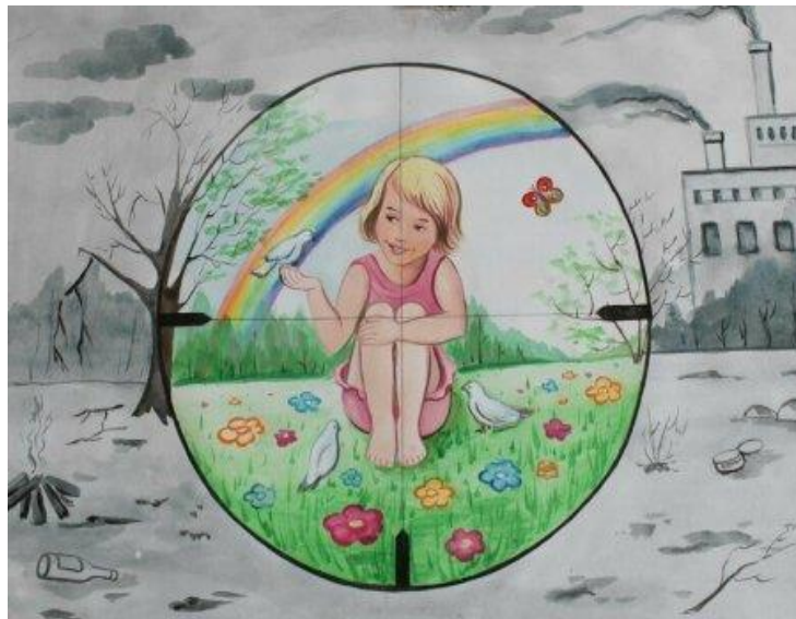
Мир глазами детей

сравнению с XVI–XVIII вв. изменение жизни, что выступает неизбежным условием эволюции и развития; развитие технологий, в том числе социальных, и как одно из следствий — изменение функций социальных структур и институтов (люди научились использовать их не по назначению, в своих целях). Нужно не забывать, что социальная эволюция опирается не только на индивидов, склонных думать о благе других, но и не меньше на тех, кто заботится прежде всего о себе и считает нормальным эксплуатировать других, а также использовать в собственных целях социальные нормы и институты.